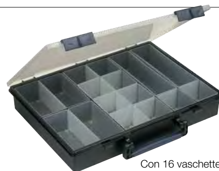
Con 16 vaschette