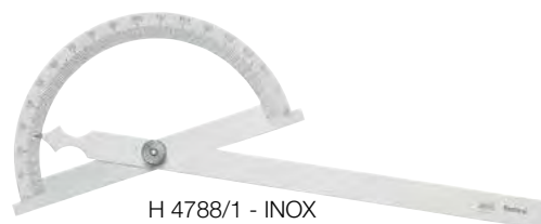
H 4788/1 - INOX