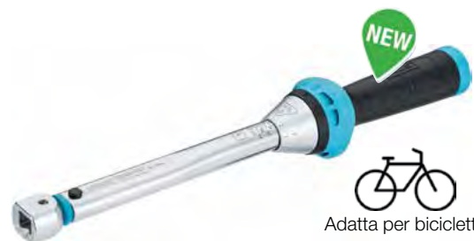
Adatta per biciclette