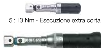
5 ÷ 13 Nm - Esecuzione extra corta