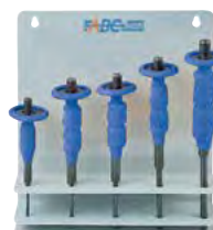
Cacciaspina di ricambio con impugnatura ergonomica Pag. 321