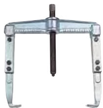
Estrattori per interni ed esterni Pag. 303