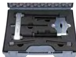
Assortimenti di estrattori, separatori Pag. 150