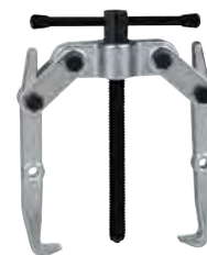
Estrattori con impugnatura a T Pag. 301