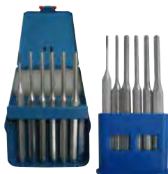
Serie di 6 cacciaspina Pag. 320