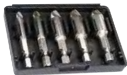
Serie di 5 estrattori per viti Pag. 295