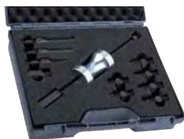
Assortimento con estrattore per spine Pag. 298