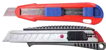
Cutter con lame a settore Pag. 328