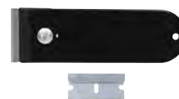
Raschietti per usi vari e lame di ricambio Pag. 340