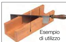
Esempio di utilizzo