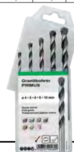
B 3630 /7 gr.5