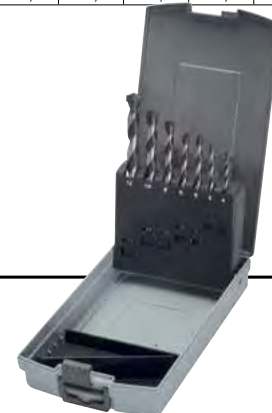
B 3630 /7 gr.7