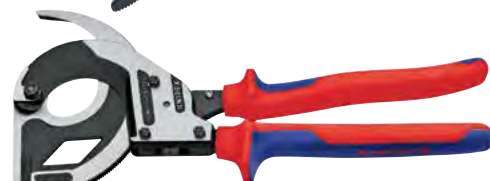
B 2150 gr. 320 mm

Cremagliera su corona dentata a 3 livelli