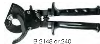
B 2148 gr.240