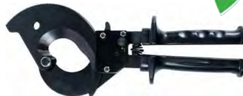
B 2148 gr.280