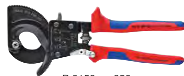
B 2150 gr. 250