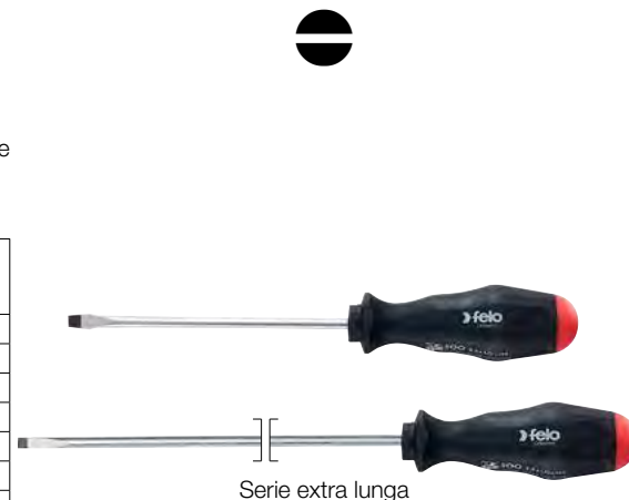
Serie extra lunga