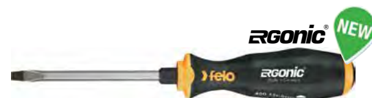
Lama esagonale con esagono di manovra

Con lama in acciaio al cromo, cromata opaca, punta brunita